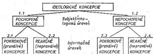
Schéma formovania typov presvedčenia na takejto úrovni analýzy bude potom vyzeráť (obr. 2):

V prvom prípade (1.1) pri uvedomelom formovaní presvedčenia prichádza do úvahy: buď pochopenie a uvedenie si faktu, že základné koncepcie správne vystihujú reálne procesy a vzťahy medzi javmi, to znamená, že sú to pravdivé a teda pokrokové koncepcie (2.1), alebo uvedenie si toho, že tieto koncepcie sú lživé a zo spoločenského hľadiska reakčné idey (2.2).